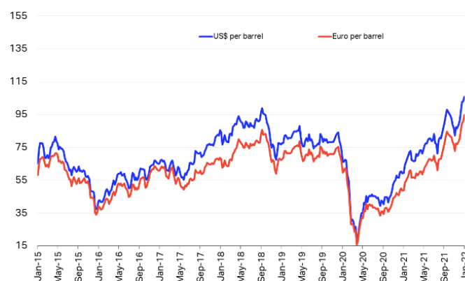
Jet Fuel Price Currency Comparison

Samtidigt fortsätter priset på flygbränsle att stiga och befinner sig i dagsläget på en nivå av ca 250 US cents per gallon vilket är en ökning på knappt 80% under det senaste året.